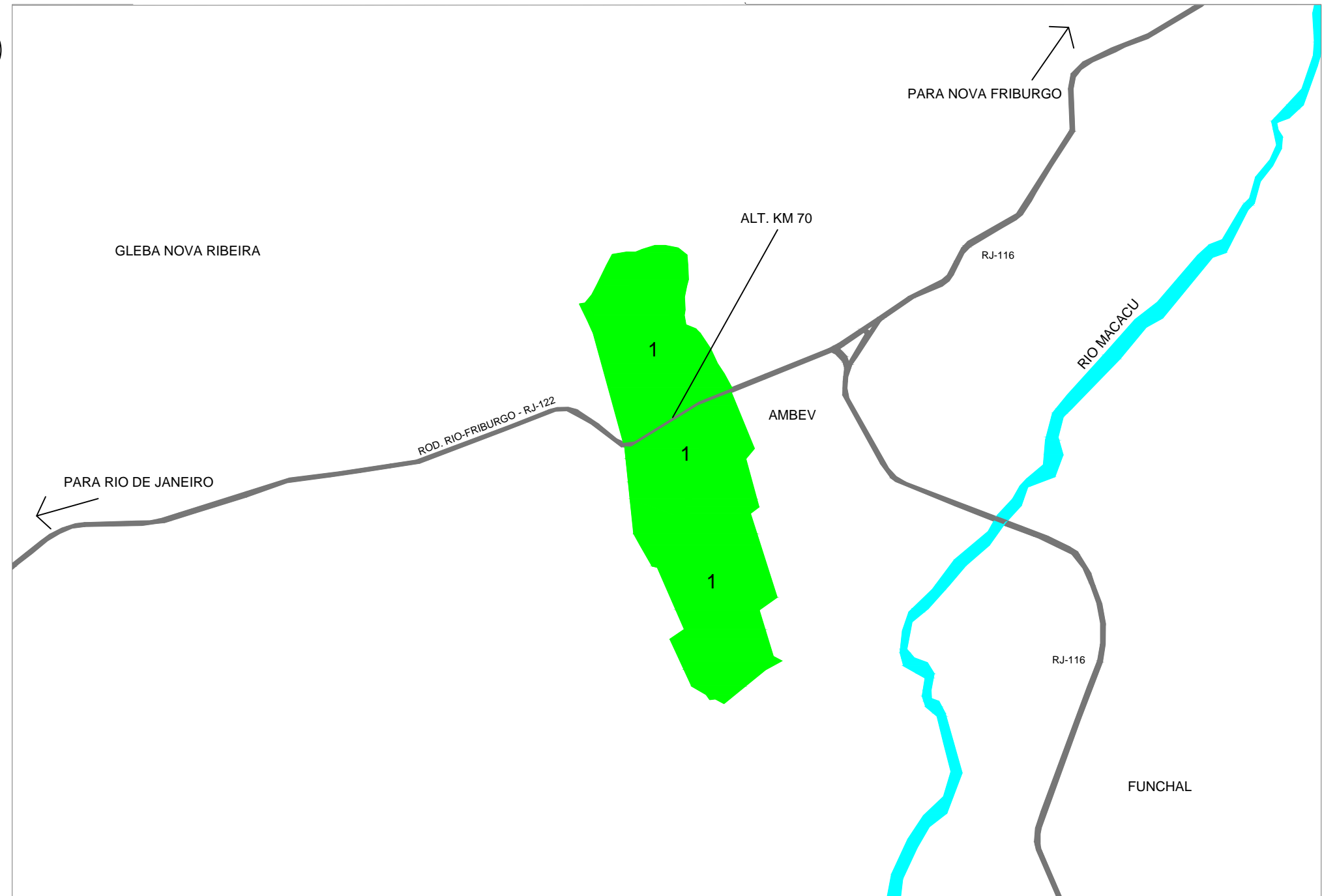
2 LOCALIZAÇÃO DAS PROPRIEDADES Escala: 1/30.000