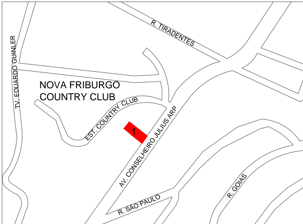
2 LOCALIZAÇÃO DA PROPRIEDADE Escala: 1/3000