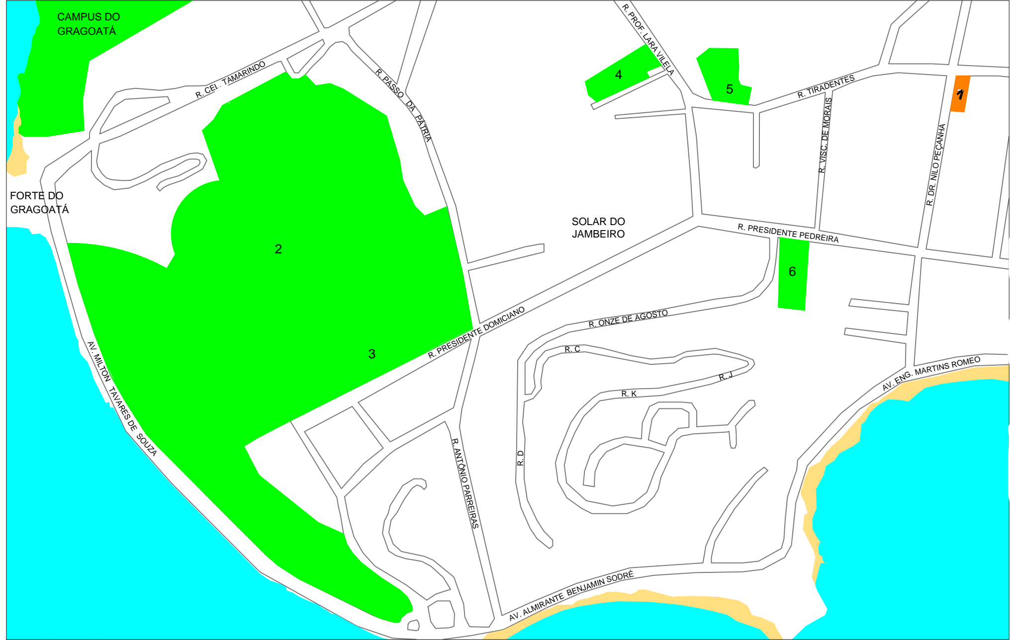
2 LOCALIZAÇÃO DAS EDIFICAÇÕES Escala: 1/5000