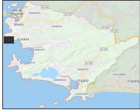
1 LOCALIZAÇÃO NO MUNICÍPIO Sem escala definida