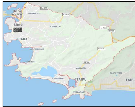
1 LOCALIZAÇÃO NO MUNICÍPIO Sem escala definida